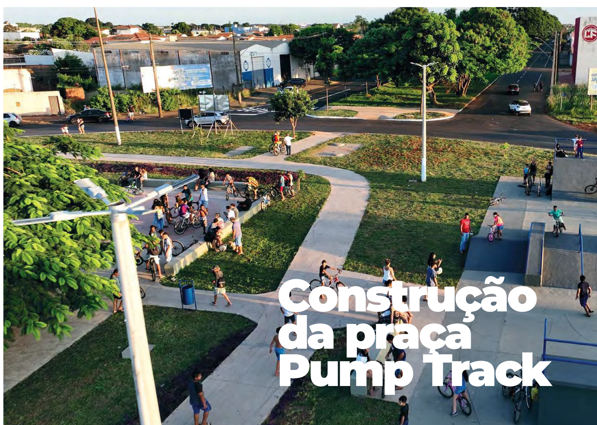
Construção da praça Pump Track