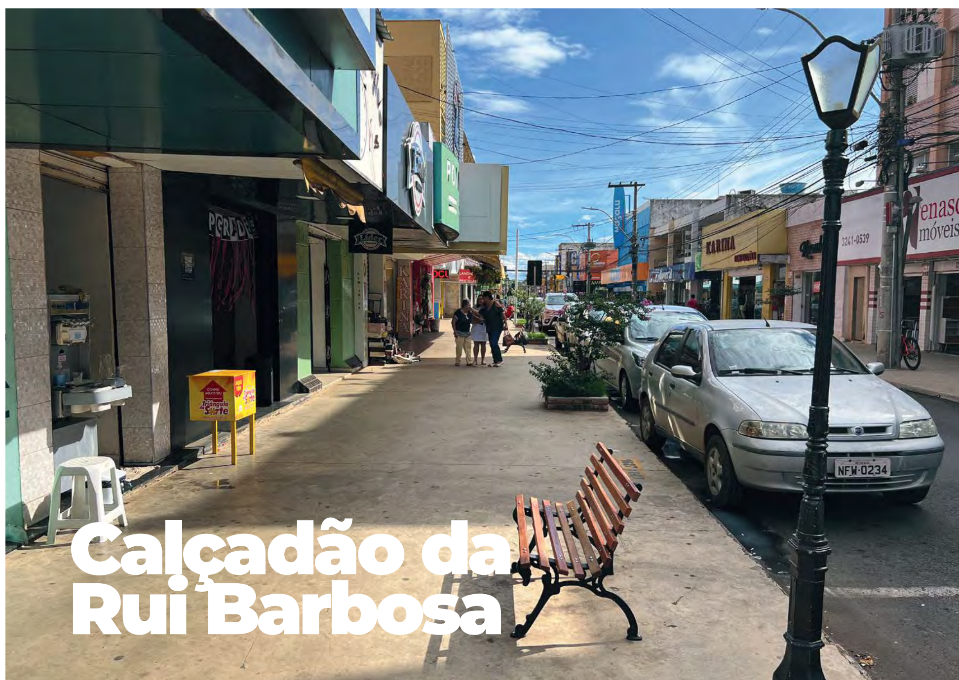
Calçada da Rui Barbosa