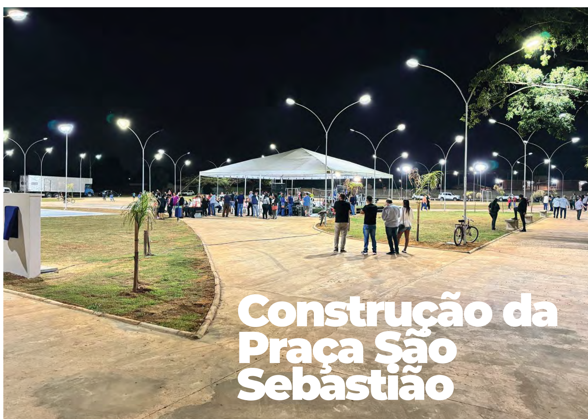
Construção da Praça São Sebastião